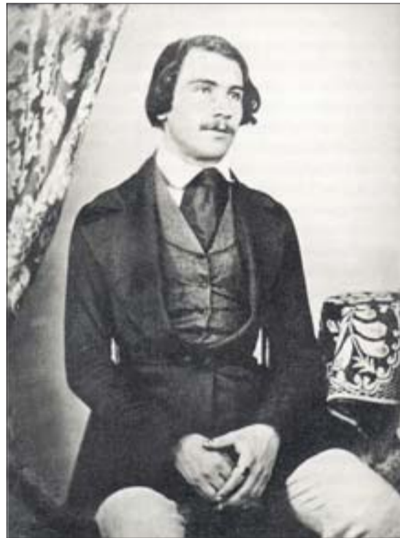
Jacob Burckhardt in Paris 1843