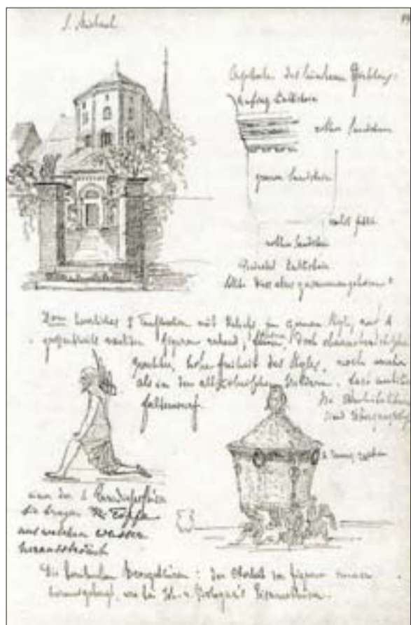
Westwerk von St. Michael und Kapitell mit Beischriften Burckhardts aus dem Skizzenbuch, B 44 r – obere Hälfte (aus: Boerlin-Brodbeck, Skizzenbücher)