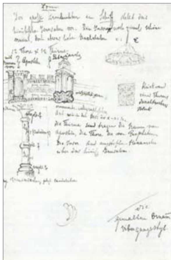
Gesamtansicht und Details des Hezilos-Radleuchters im Dom aus dem Skizzenbuch, B 44 v – obere Hälfte (aus: Boerlin-Brodbeck, Skizzenbücher)