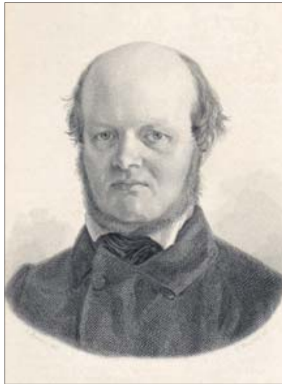
Franz Kugler, Kunsthistoriker, Lehrer und Freund Burckhardts (aus: Kugler: Handbuch der Kunstgeschichte, Stuttgart 1861)